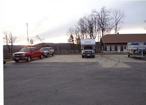
1º piso executado por uma Laser Screed