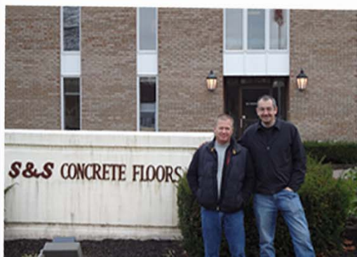
Visita na S&S Concrete Floors